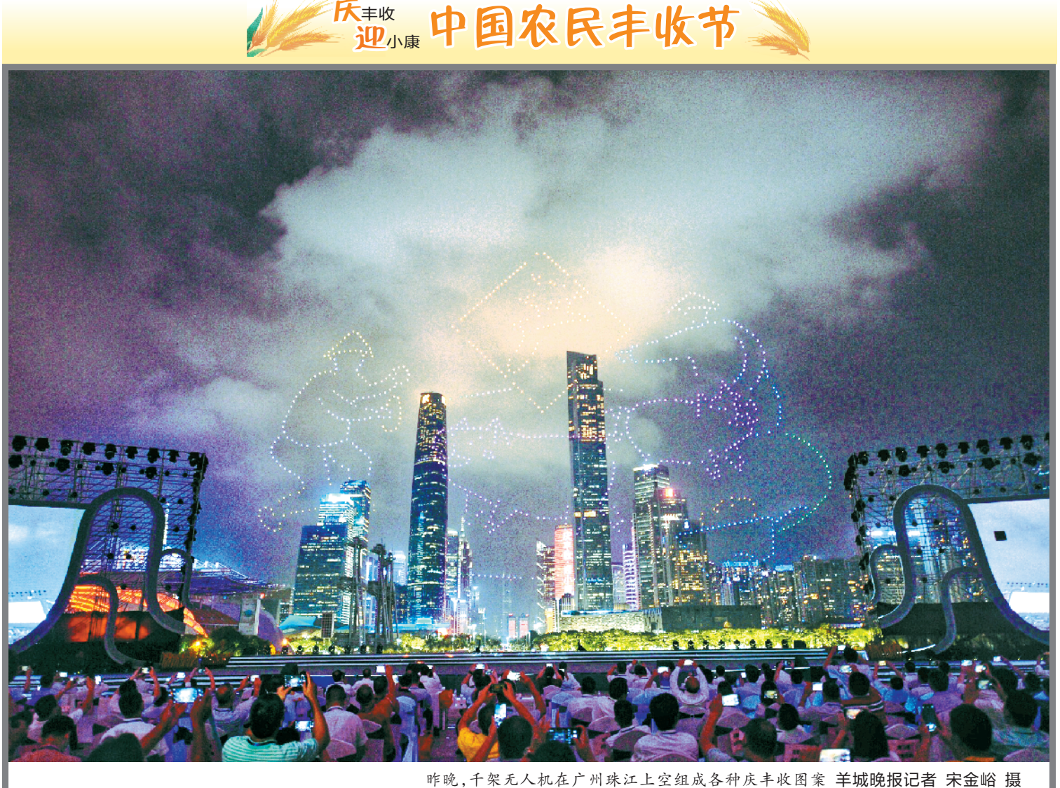
昨晚,千架无人机在广州珠江上空组成各种庆丰收图案

新闻管家 看新闻管家 知今日天下 大兴机场旅客吞吐量首破千万人次 22日上午,准备乘坐南航CZ8887航班前往上海的聂先生幸运地成为大兴机场第1000万名旅客,这也标志着大兴机场自投运以来旅客吞吐量首次突破千万人次大关,预计到2020年底,大兴机场投运以来旅客吞吐量将达到1600万人次。 截至9月21日,大兴机场累计完成航班起降8.4万架次,货邮吞吐量约3.9万吨。在大兴机场运营的南航、东航、国航、中联航、厦航等18家国内航空运输企业,运营国内航线187条,联通全国129个航点;开通货运航线5条。(唐蔚 哈浩然)