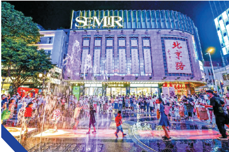
北京路当前客流量已恢复到往年水平

据了解,此次对圣贤里、李白巷等约5200米的后街环境进行提升,对约3000平方米的第五立面进行整治,将街区打造成岭南建筑民国风建筑博物馆特色。