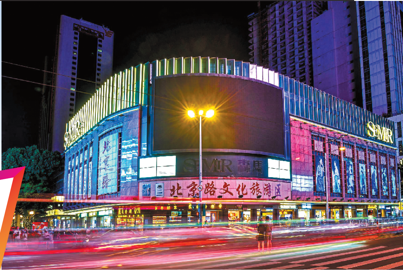
升级改造后的北京路 越宣 钟涌 摄