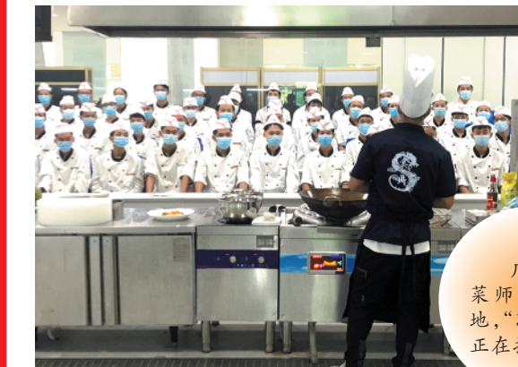
广东省粤菜师傅培训基地，学员们正在接受培训

“粤菜师傅”工程不仅带动省内各地群众致富。随着工程的不断推进,广东将“粤菜师傅”导入省际扶贫协作,“舌尖上脱贫路”的影响力辐射全国。