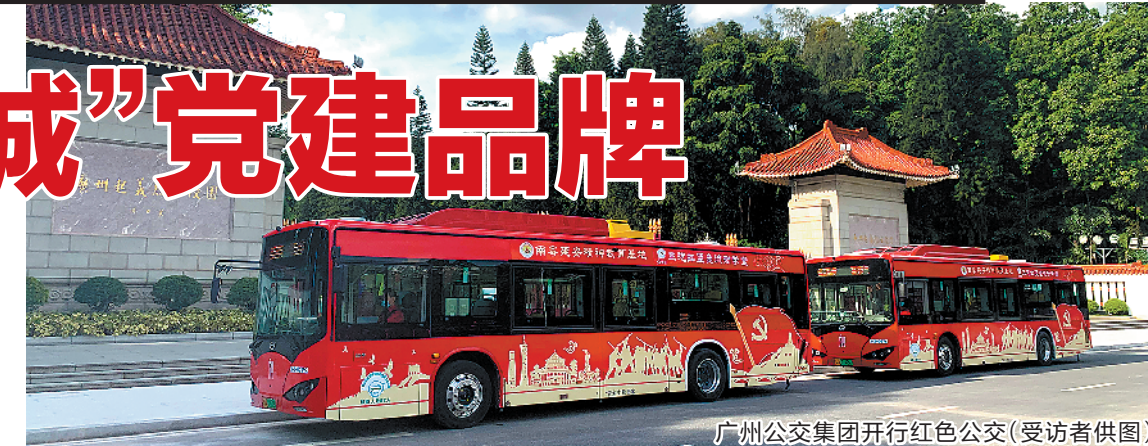
广州公交集团开行红色公交

广州公交集团不断加强基层班组党建,以满足市民乘客对美好生活的需求为发力点,在服务窗口设置“党员示范岗”“党员责任区”,引导党员亮身份、亮职责、亮承诺。高质量保障全球财富论坛、世界航线大会等重要活动交通服务任务,不断满足春运、暑运等重大节假日群众出行需求。特别是在春运期间,针对深夜高铁到达旅客疏运难的情况,广州公交集团党委提出“无论多晚,我们为您守候”的服务承诺,创新采用“联程转运”模式实现了公交兜底保障,从广州白云国际机场、广州南站到市区无缝连接,