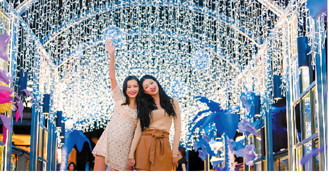
花展拍照艺术感十足 在天环广场纸艺

黄金周期间，广州正佳广场还将同时开放极地海洋世界、雨林生态植物园、自然科学博物馆、开心麻花剧场等多个活动，其中正佳海洋馆将举办海洋绮梦主题展并可在馆内享用海洋中秋团圆饭；正佳雨林生态植物园则将开启魔法雨林之旅，孩子可以穿上“魔法斗篷”，挥动魔杖与园内动植物进行互动；在正佳自然科学博物馆内还可以亲手制作各种中秋立体画及模型，另外还有月光观光的科普课程向孩子开放。