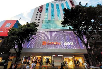
广百百货北京路店

假日期间，总少不了老友聚会，一场回忆青春之旅相信能够成为你的选择。广州凯德乐峰广场近日开启了“校服至上”主题校服展2.0，数十所广州中学的校服在广场内一一展示。羊城晚报记者近日走访注意到，凯德乐峰广场每一个楼层均已布置了不同的中学校服元素，在一处扶梯上下口处可以看到一面贴有各所中学动漫人物的“校服中央片墙”，实体的校服展示在楼层中央的护栏处处可见，还有“校服至上”2.0的大型装置可供顾客拍照留念。