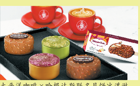
太平洋咖啡×哈根达斯联名月饼冰淇淋