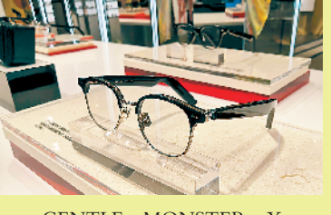
GENTLE MONSTER X 华为智能眼镜

朋友送礼，重在表达心意。近期，韩国眼镜品牌GENTLE MONSTER与华为在第一代智能眼镜产品的基础上将设计美学和创新技术进行全新升级，推出13款全新Eyewear II系列。