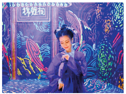
多个国风场景任你拍摄

9月18日至10月8日，广州富力海珠城icon推出国潮金秋市集，据了解，本次市集集结了45个摊位，梵高潮物、各种手作器物、独立设计饰品、原创包包、特色插画、小挂件等都在市集上看得见。在潮玩区的盒蛋机上还可以抽取盲盒，为购物过程添上“挖宝”乐趣。羊城晚报记者现场走访发现，售卖尼泊尔风格饰品的摊位受到顾客的喜爱，不少顾客停下脚步试戴这些具有别样风情的手工围脖、包包等产品。