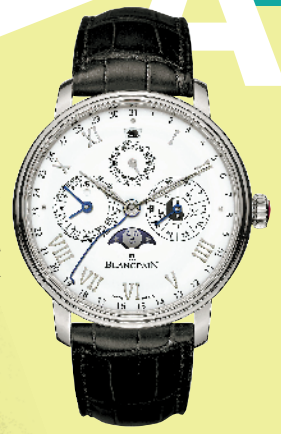
宝珀的中华年历腕表

“双节”佳礼清单，选礼不再纠结 2020年中秋国庆将近，应节商品层出不穷，看见琳琅满目的商品要如何挑选？如何满足亲朋好友的不同审美和口味？查看以下佳礼清单，帮你解决选礼的烦恼。