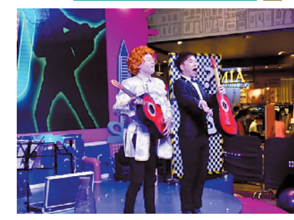
嘿皮匣子《疯狂音乐家》亲子音乐魔术互动剧

假日逛街就要和小伙伴尽情玩耍，如果上述路线都没有打动你的内心，那么这条路线将充分释放你的假日活力。