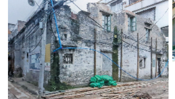
永庆坊改造前