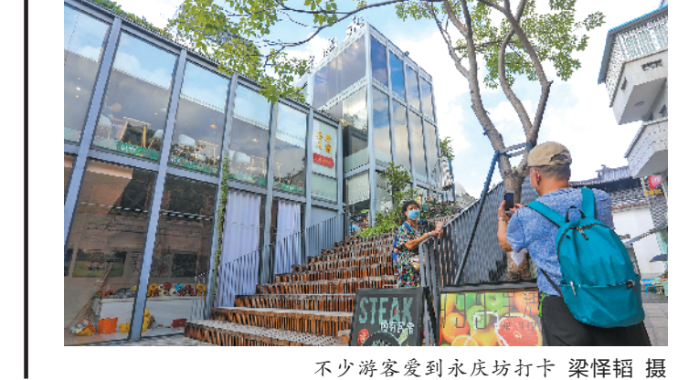
不少游客爱到永庆坊打卡

喜欢走路的达人说,北京有南锣鼓巷,成都宽窄巷子,广州则有永庆坊。在很多普通游客眼里,全新改造后的永庆坊,整洁美观、古今融汇,成为网红打卡点。但在更多街坊和专业人士眼中,焕新的永庆坊,活化的不仅是建筑与居住环境,更有广州的传统文化,让更多人能更接近粤剧、亲近西关大屋,这也是活化永庆坊的精髓所在。