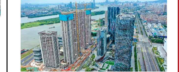
改造后保利鱼珠港航拍