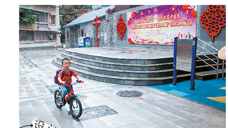
老小区改造后小朋友的活动场所更加开阔 拍摄:兰蕙园 徐伟伦 摄

这一轮城市更新,广州“政府领衔、大师设计、民众参与”的特色之路正走得更加坚定、气势如虹。