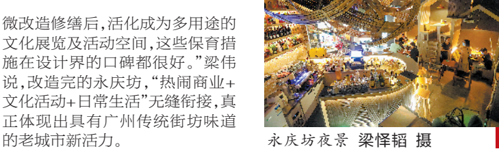
永庆坊夜景