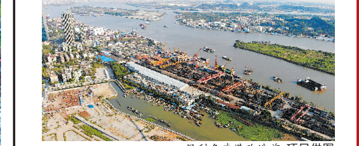
保利鱼珠港改造前

近日,羊城晚报记者实地走访了专业市场蝶变而成的保利鱼珠港及微改造后的海珠区兰蕙园,感受新一轮更新的力量。