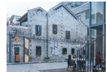
永庆坊改造后