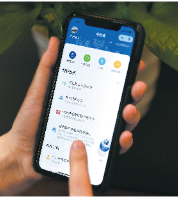
纳税人使用“粤税通”小程序办理税费事项

“粤税通”上线后，不仅办税效率提高了，办税流程也更加顺畅。“粤税通”推出了“新办企业”“房屋交易”“车船办税”“智能预约”等个性化套餐，实现了业务整合、流程优化和资料简化的“一条龙”服务。推出“新办企业”和“智能预约”套餐，纳税人在通过企业信用代码和法人身份信息在线核验后，便可一站式享受财务会计制度备案、存款账户账号报告、签订企税银三方扣款协议、发票票种核定及最高开票限额申请等涉税服务；“智能预约”套餐为纳税人提供了预导税、预填单、预审核、预约一体化服务，能更精准地定位办税需求、准确做好“一次性告知”，变更重跑、多次跑转变为“最多跑一次”。截至8月，“粤税通”新增了174项业务，共办理各