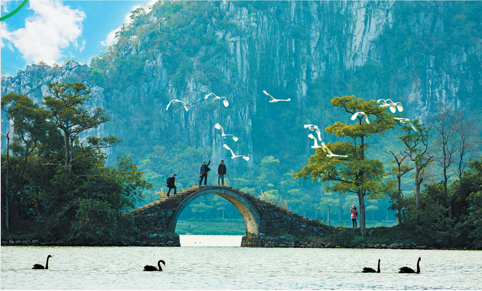
仙鹤呈祥

砚阳湖：形状似砚台，水面面积1500多亩，设有大型绿化开放空间，从高空俯瞰，犹如翡翠宝石。