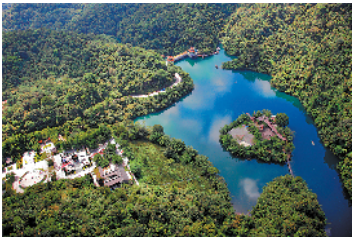
醉绿天湖

玉器街：四会市荣获“中国玉器之乡”称号，玉城也就成为了四会市的简称。玉器街分三大部分：玉器城、玉器街、玉器天光墟。