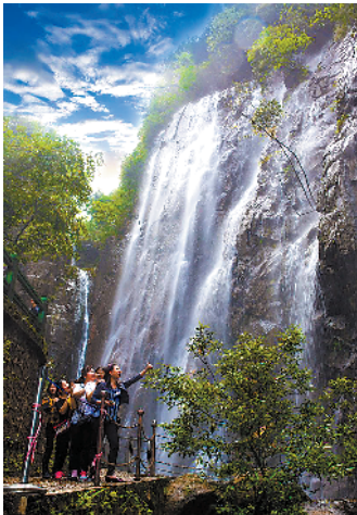
四会奇石河银龙大瀑布