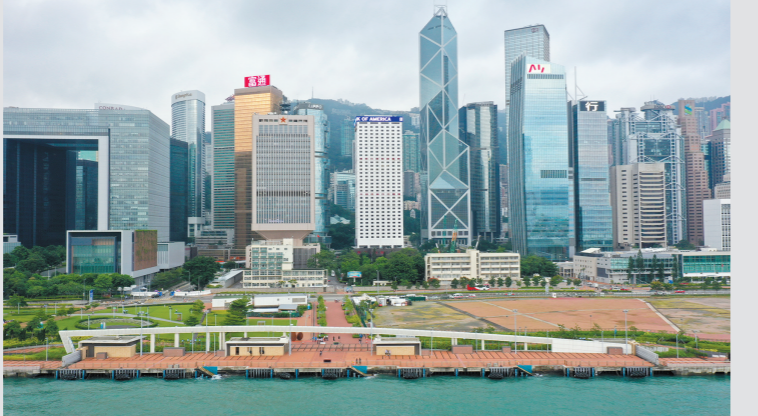
这是中区军用码头(9月29日摄)

据新华社电 香港特别行政区政府与中国人民解放军驻香港部队29日上午在特区政府总部签署《中区军用码头移交备忘录》，标志着香港特区政府正式将中区军用码头移交给解放军驻港部队。