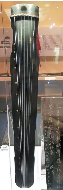
“松石间意”古琴底面沈周等题刻