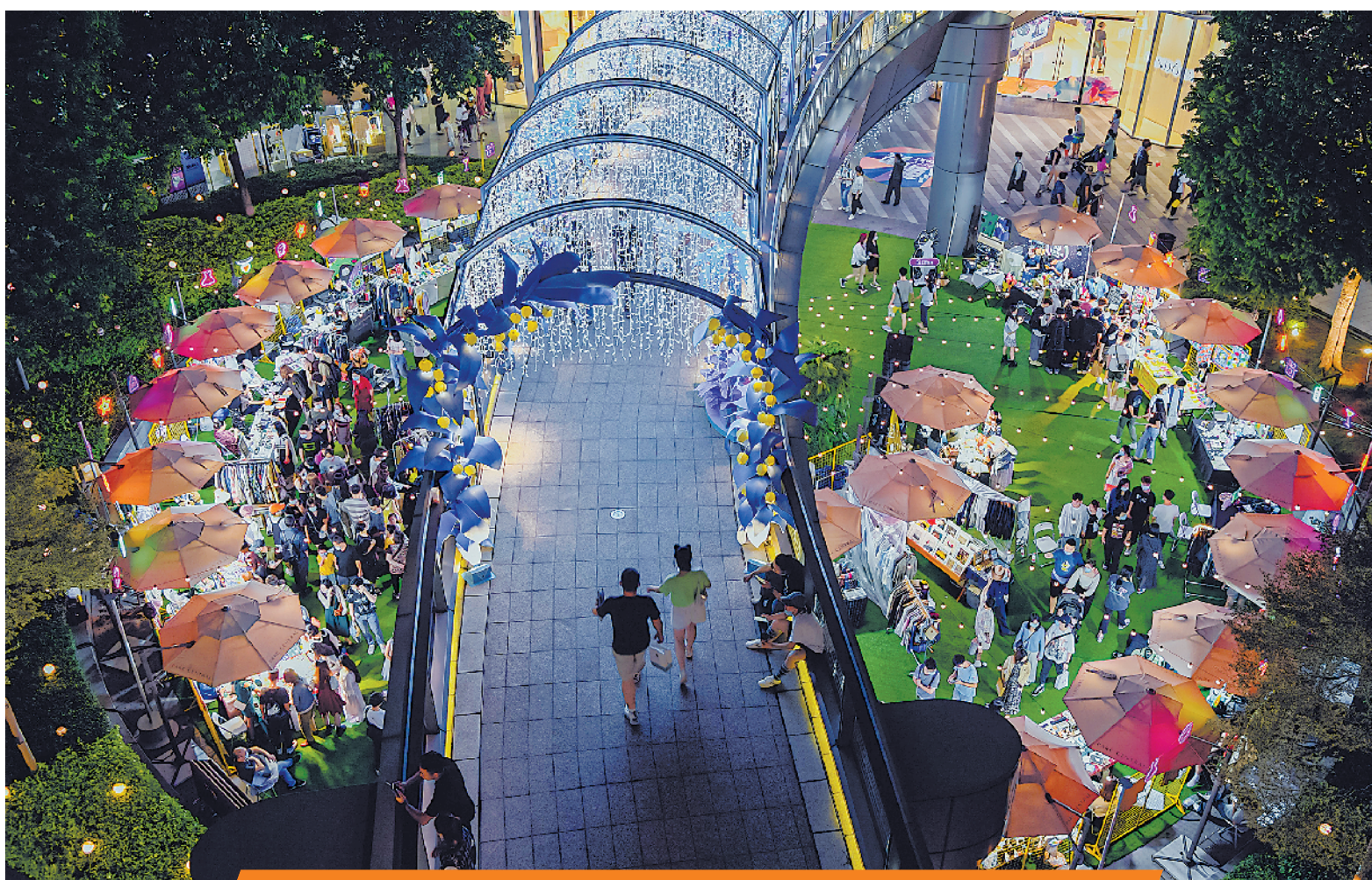
广州天环广场的“潮集”露天夜市玩出新花样(受访者供图)

精彩纷呈的假日文化活动满足了人们的文旅需求。佛山市文化广电旅游体育局等在快手平台开展“佛游味”国庆中秋全域旅游推广,10场直播累计观看人数超1602万人次,点赞量超1040万,吸引各地游客到佛山。广州在国庆期间举办第十三届国际漫画节动漫游戏展,截至10月5日,现场观展观众总人数达到6万人次,展会同时通过各大视频平台直播,线上线下都受到观众好评。汕头市在市区公园举办“2020国庆中秋嘉年华系列活动”,围绕“百年洋楼、非遗匠作、潮汕美食、时尚潮玩”四大主题,上演百场涵盖潮剧、杂技、舞狮、民乐、街舞文艺表演,让市民游客玩乐不停歇。