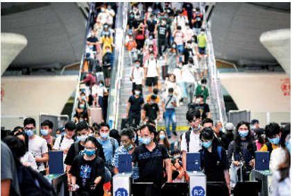
7日，广州南站迎来大批返程旅客

广州南站采取分时分站、分区域候车进行客流疏导，同时联系地方公安部门，延长城市地铁和夜间公交运营服务时间，为夜间到达旅客提供交