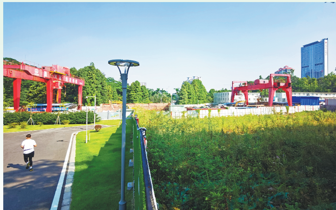
天河公园内，绿地旁边就是地铁工地

还绿于民是深化城市更新工作、推进高质量发展的重要举措，也是造福群众的民生工程。目前，在广州地铁借用天河公园用地区域，还有11号线、13号线二期工程仍在建设，而广州街坊对天河公园的复绿工程却早有