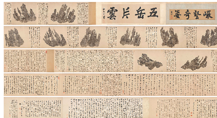
十面灵璧图卷 纸本手卷 约1610年作