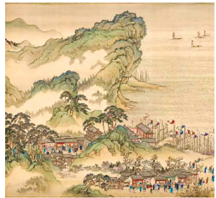
《康熙南巡图》第六卷(七段合璧示意图) 设色绢本