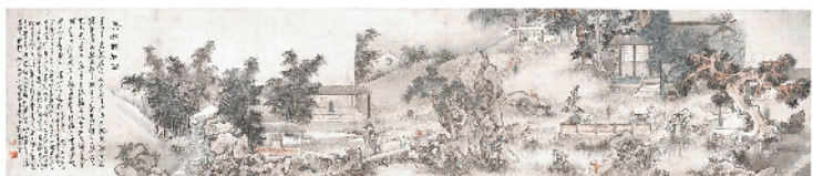
苏六朋《药洲品石图》

吕子远 作者简介:中山大学历史学博士。主要从事区域地方史研究。现任职广东东正拍卖有限公司古器物部,从事研究鉴定工作。