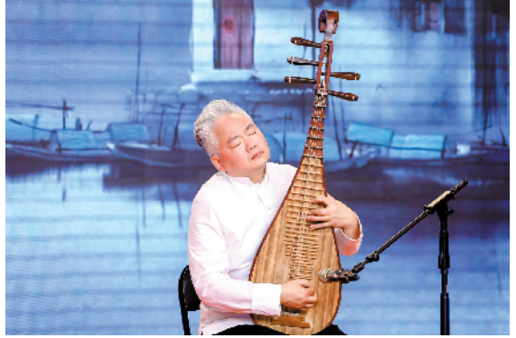
方锦龙弹奏五弦琵琶

早在2014年，《国务院关于加快发展现代职业教育的决定》明确指出，技能大师工作室应该成为推进现代职业教育发展的一种重要模式。倪惠英为著名粤剧表演艺术家，方锦龙乃当代五弦琵琶代表人物。引进两位艺术表演界的大咖建设技能大师工作室，是学校积极推进职业教育发展、打造高水平美育教育的有力举措。