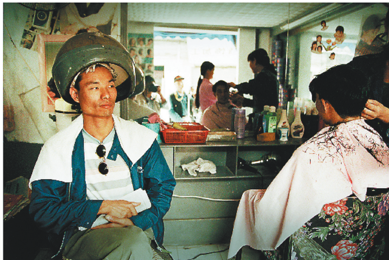
1997年，珠海翠微村的男人“赶潮流”去发廊烫发