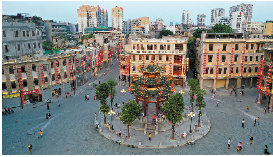
汕头小公园是汕头老城重要的文化标志，见证着城市变迁

▲1989年，汕头交通设施有限，西堤渡口成为市民主要的过海通道 十年后，西堤渡口西面的礐石大桥建成通车，市民通行更加便捷