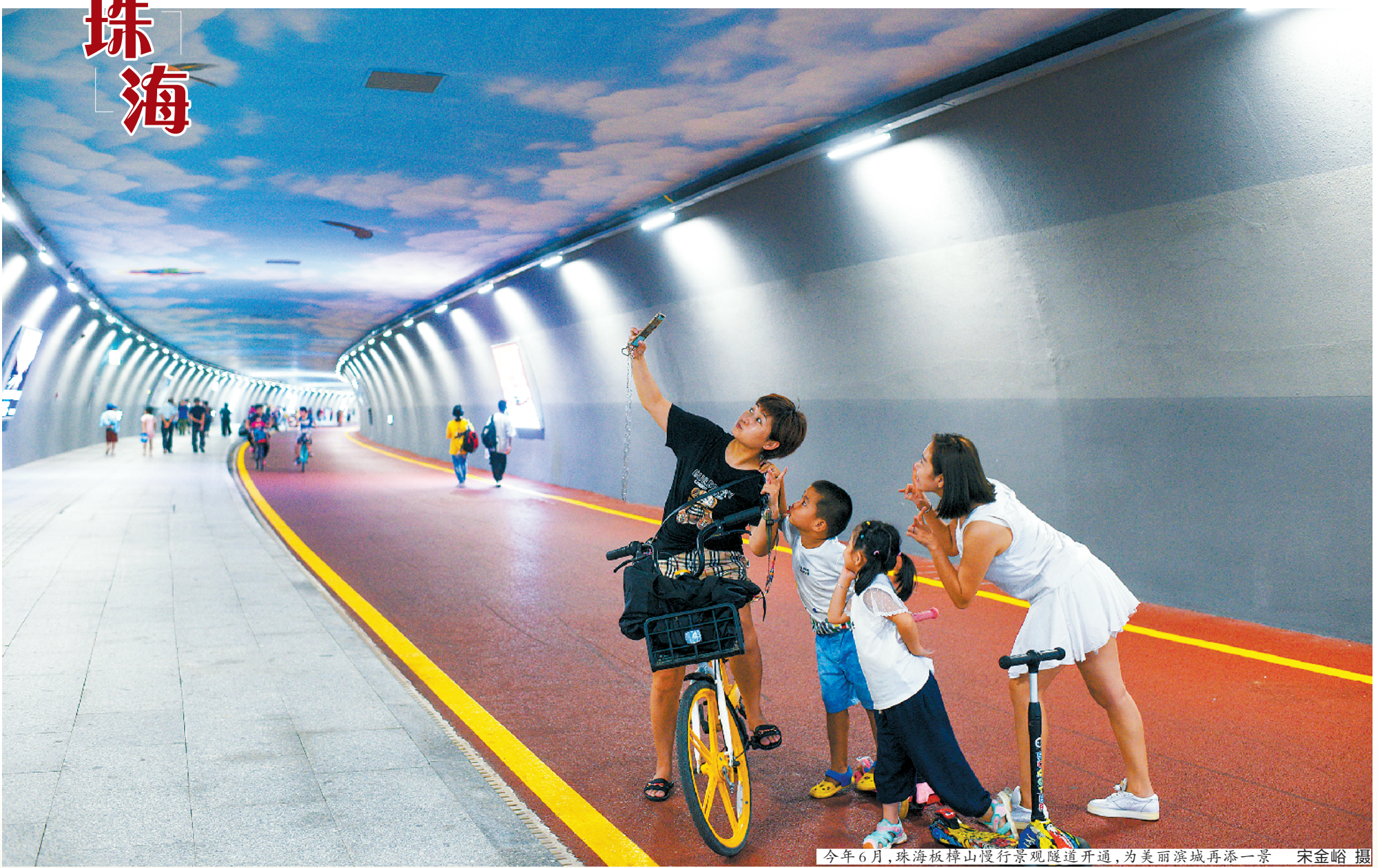
今年6月，珠海横琴山慢行景观隧道开通，为美丽滨城再添一景