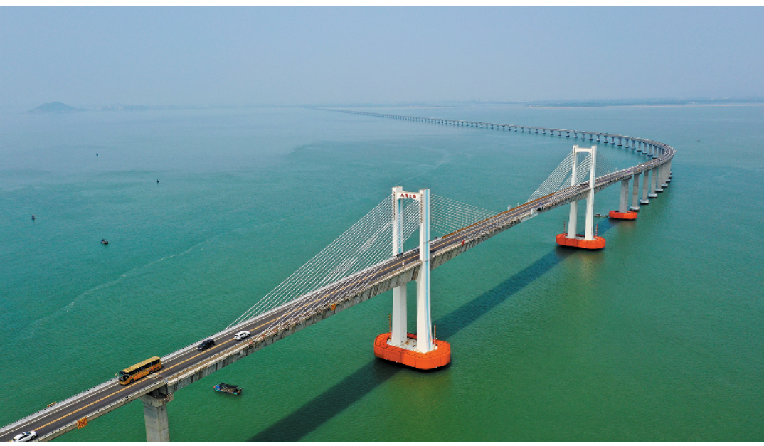
南澳大桥是连接汕头和南澳岛的重要跨海大桥

▲1989年，汕头交通设施有限，西堤渡口成为市民主要的过海通道 十年后，西堤渡口西面的礐石大桥建成通车，市民通行更加便捷