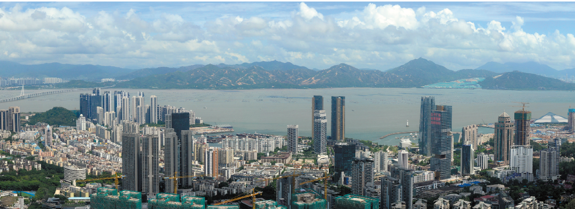
经过四十年的建设，深圳蛇口工业区已发展成外向型经济开发区