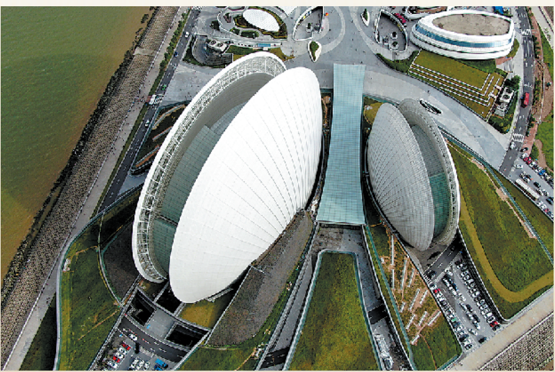
珠海大剧院是珠海市民重要的文化休闲场所之一