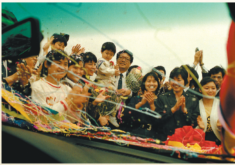
1993年，珠海首开国内“科技重奖”先河，重奖科技人员