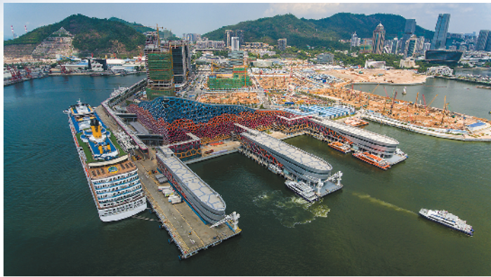
深圳太子港是深圳连通香港、走向世界的重要“海上门户” 周巍 梁喻 林桂炎 王磊 摄

▼深圳不断优化营商环境，为腾讯等企业发展提供了沃土 周巍 梁喻 林桂炎 王磊 摄