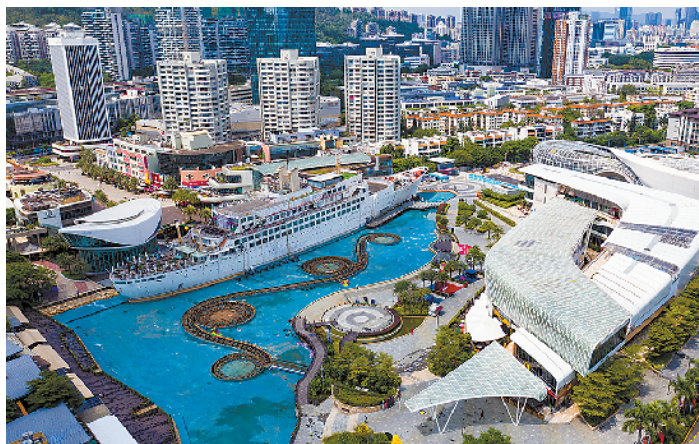
深圳大型文旅综合体——海上世界，是蛇口工业区重要的地标