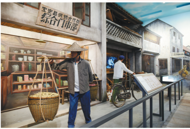
还原老宝安县城场景

第四部分为“先行示范再出发”，主要围绕中央对深圳先行示范区的“高质量发展高地”“法治城市示范”“城市文明典范”“民生幸福标杆”“可持续发展先锋”五个战略定位和工作部署，展示先行示范区建设进展，并在最后展示深圳有力有效应对中美经贸摩擦以及奋力夺取疫情防控和经济社会发展“双胜利”的工作成效。