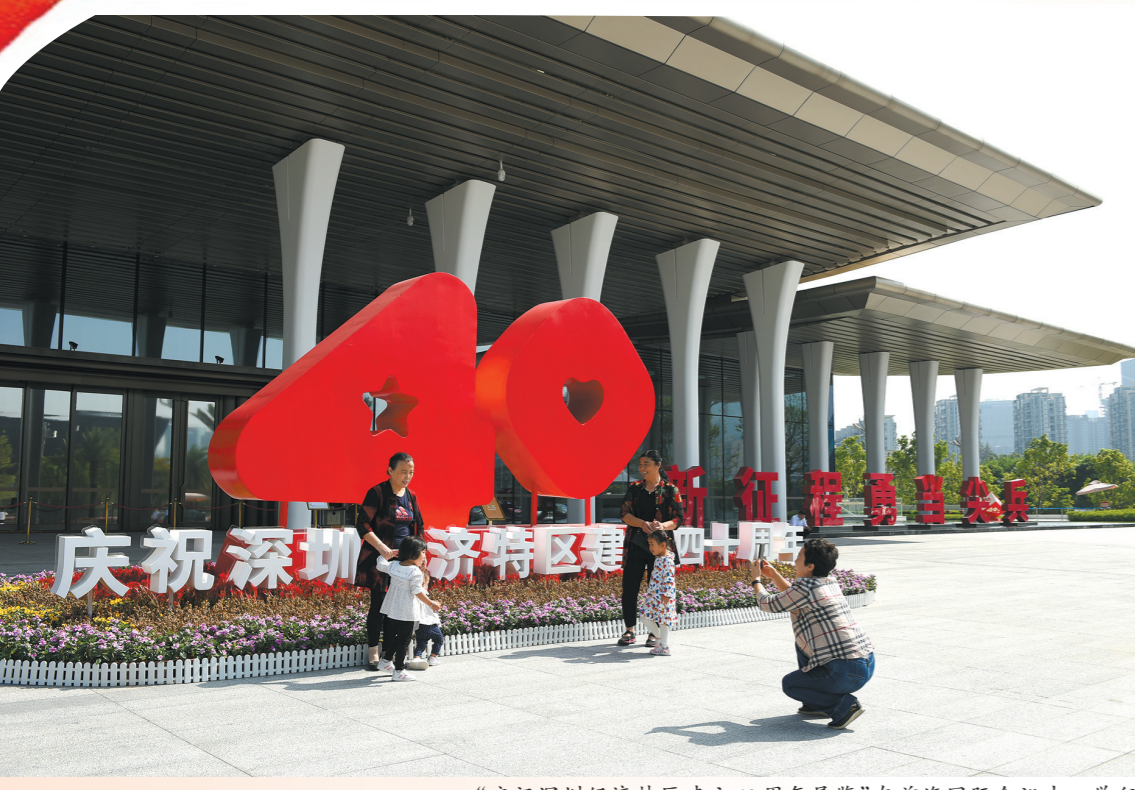
“庆祝深圳经济特区建立40周年展览”在前海国际会议中心举行

展览还采取了最严格的措施做实做细环保控制工作，成立专业团队，高标准强化施工现场环保管控与治理。选用环保材料布展，并加强对进场物料的达标检测，确保展厅环保安全。