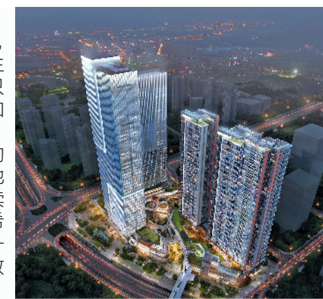
广汇新世界金融中心是具国际前瞻性的Co-Central都会中心