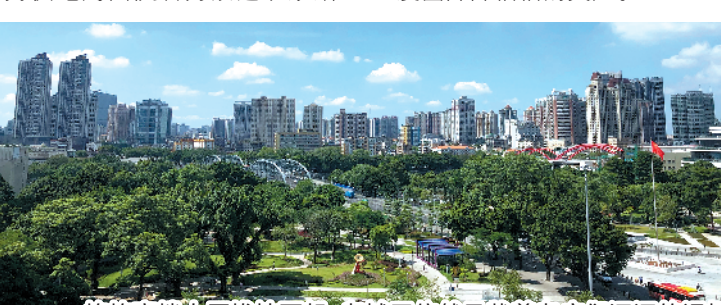
一栋栋高楼大厦拔地而起，老城区依然承载着老广们深深的记忆