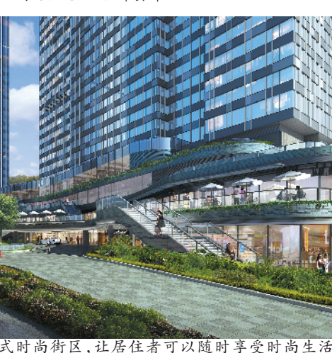
广粤天地沉浸式时尚街区，让居住者可以随时享受时尚生活