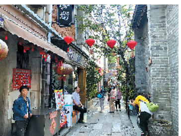
游客在永庆坊打卡留影