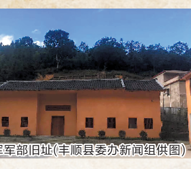
红十一军军部旧址(丰顺县委办新闻组供图)