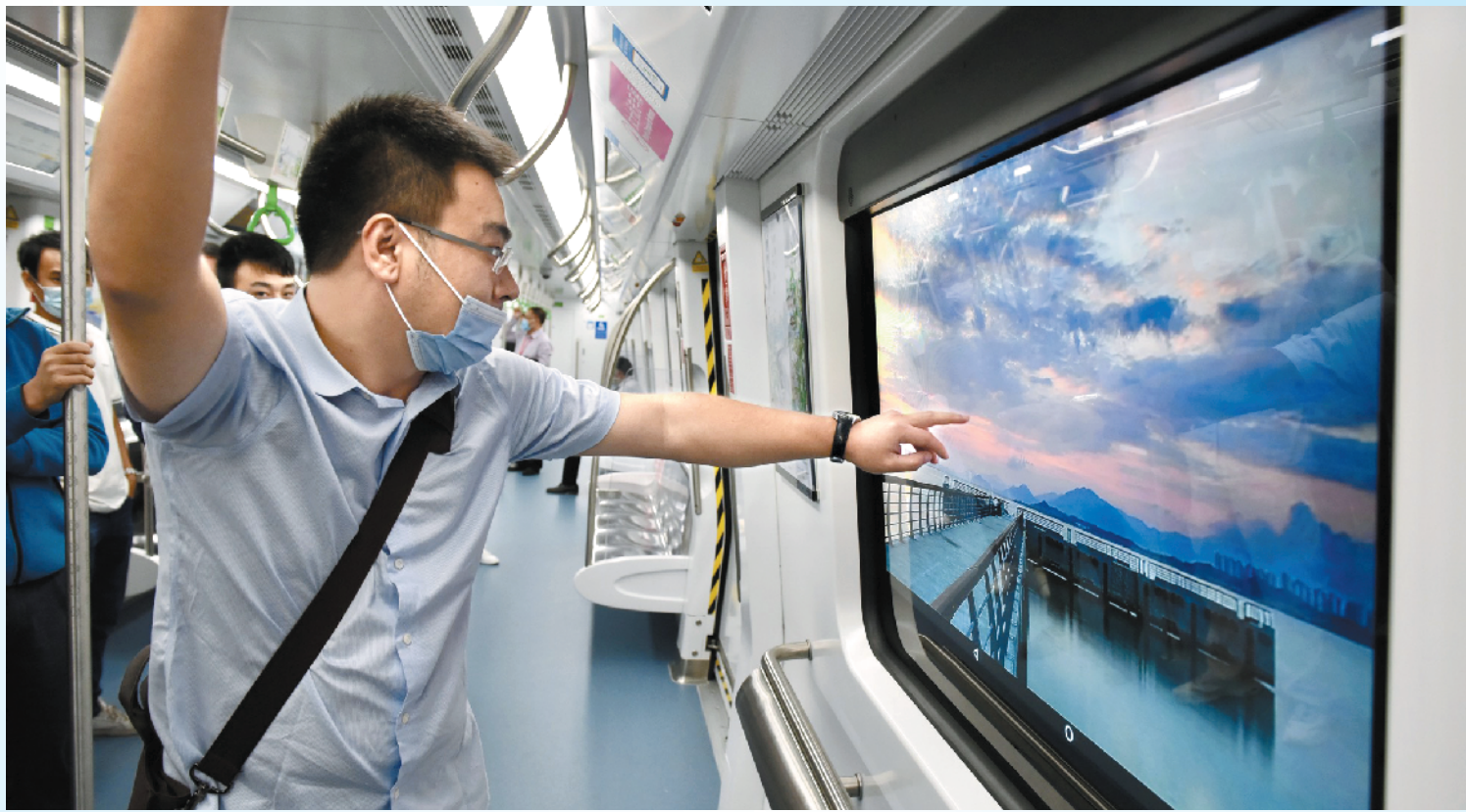
车厢内新增触屏显示各站信息

28日,深圳地铁2号线三期、3号线三期、8号线一期同步开通初期运营。此外,港铁(深圳)4号线三期也于同日开通。4条新线的开通使深圳城市轨道交通线路增加到11条,运营里程突破400公里,极大提高了市民的出行效率。