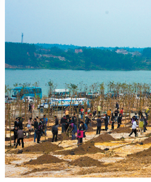
茂名人民在露天矿区种树

直到党的十八大以后终于被改变。党的十八大以来，以习近平同志为核心的党中央大力推进生态文明建设，并将其列为“五位一体”整体布局。在经过数十次的现场深入调研和科学论证后，2013年，茂名市委、市政府研究决定“在露天矿范围内，关停所有采矿生产，把露天矿打造成生态公园”。