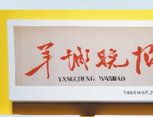
1958年，《羊城晚报》刊登的《茂名页岩油厂向毛主席报喜：首次提炼出页岩原油》报道

这个消息报告给了党中央和毛泽东主席。1956年4月25日，毛泽东主席在中央政治局扩大会议上作《论十大关系》中提到：“现在我们在广东的茂名(那地方有油页岩)搞人造石油，那也是重工业。”1958年，周恩来总理亲自部署，“挖矿取宝炼石油”的大会战开启。茂名露天矿最后一任矿长、已80多岁的黎安兰老人回忆：上万名科技人员、技术工人和民工组成建设大军，用锄头铁锹加扁担，靠肩挑手提板车拉，在雷打岭附近上演了一出现代版的“愚公移山”。接着，兴建大型干馏炉和炼油厂，“挖岩取火”，炼出一桶桶页岩油。