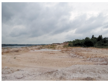
露天矿区土地荒芜十年，寸草不生

陋，开采露天矿对环境造成了一定影响。“特别是1992年之后，虽然停止了对油页岩的开采，但对伴生矿高岭土、煤的开采还在继续，加上管理上的混乱，更是对这里的环境造成了严重污染。”茂名露天矿生态公园工作人员鲍水辉告诉记者，当时，工业垃圾、生活垃圾、洗矿废水都被排到这里，当地人形容这里是“烟尘万丈高，油污遍地流”。水资源也被污染了，周边几千亩耕地被丢荒。