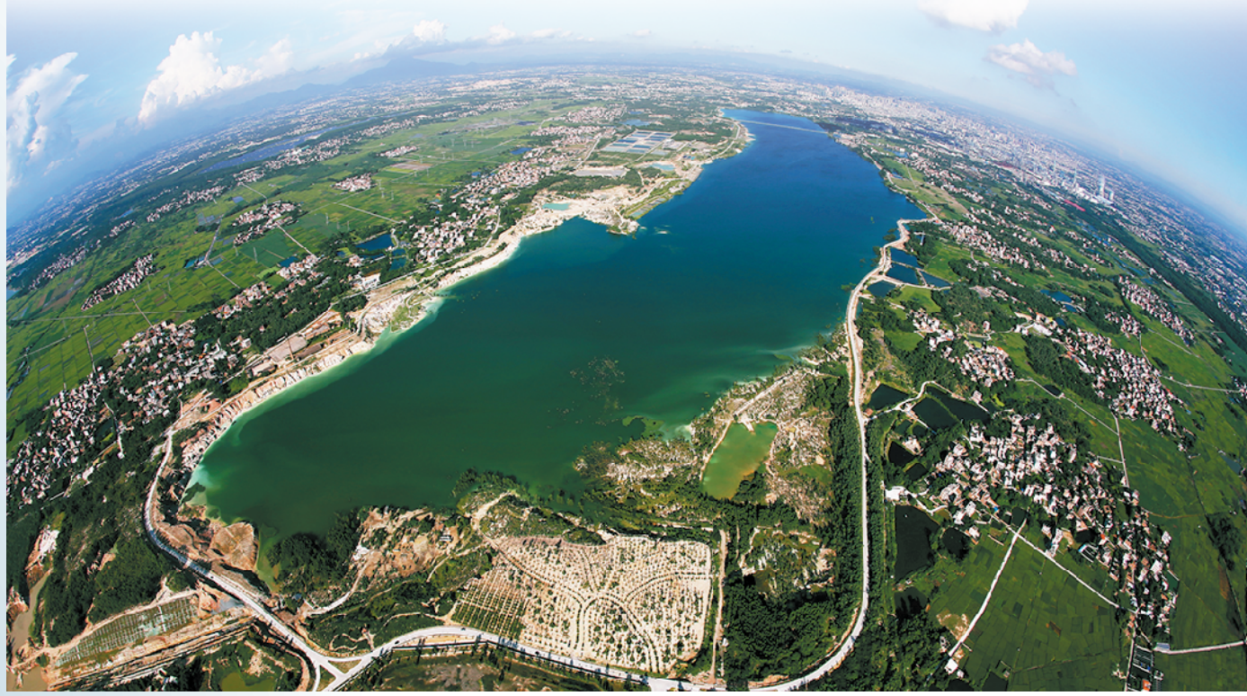
修复后露天矿生态公园的“好心湖”