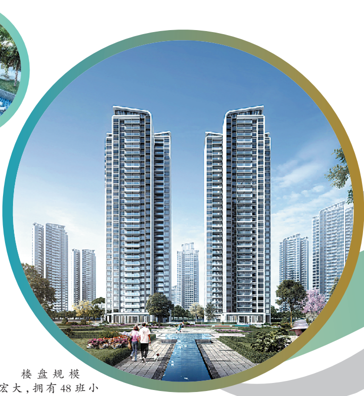
楼盘规模宏大，拥有48班小学、商业街等配套设施