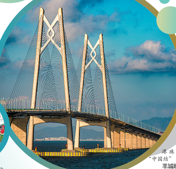
港珠澳大桥“中国结”