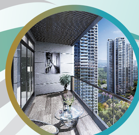
双中心园林设计，让绝大多数住宅都拥有良好的景观

该楼盘配套的约1000平方米下沉式“欢乐泳区”则融入新加坡式设计元素，游泳池的景观十分漂亮，在此可游泳竞技，亦可休闲娱乐，还有儿童游泳区。而小区所有架空层被设计为九大主题会所，为一家老小打造全方位的“全龄段会所”。