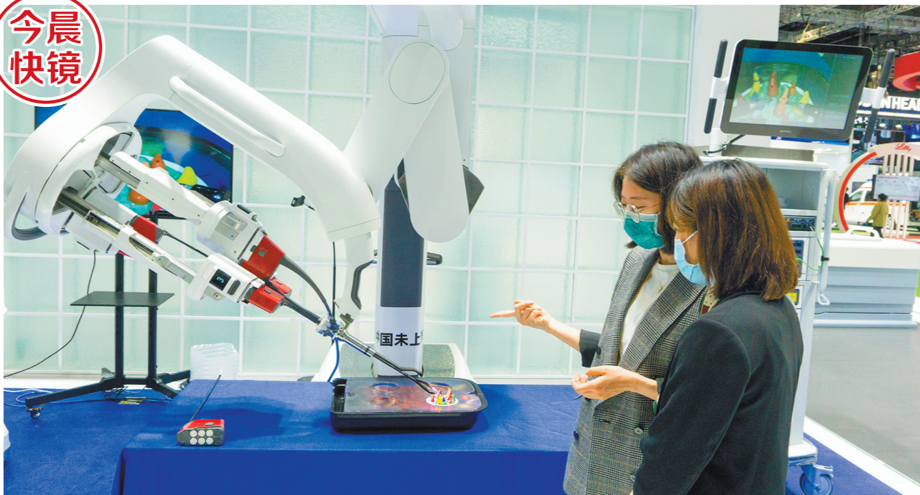
进博会展出的“网红”产品达芬奇手术系统