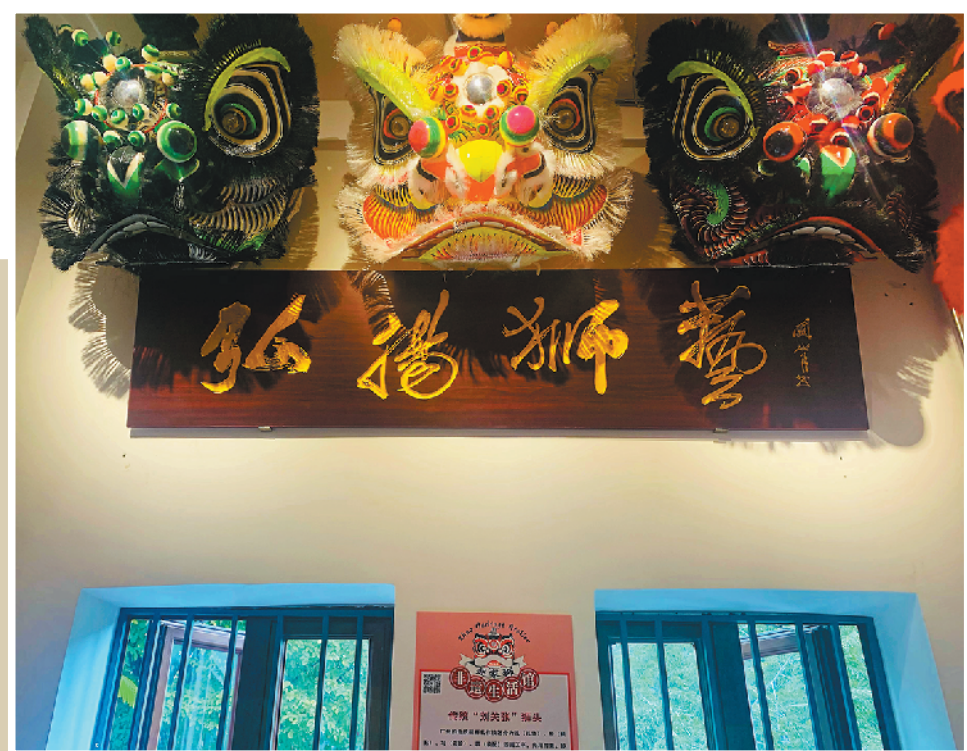
赵家狮非遗生活馆二楼十分醒目的“弘扬狮艺”