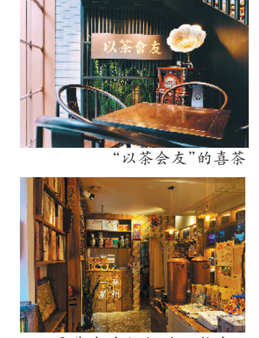
承载老广记忆的旧物仓·一桌广州一榻

喜茶永庆坊店作为喜茶首家岭南“茶馆”，该店从选址到设计均富有西关特色。荔湾区恩宁路凝聚了西关历史生活精粹，永庆坊则是展现骑楼文化的网红打卡点。喜茶从永庆坊的文化底蕴和西关人家“得闲饮茶”的生活态度中获得了灵感，巧用传统牌匾文化，在其金字招牌上书“以茶会友”，招徕过往宾客。