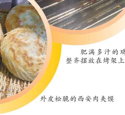
肥满多汁的鸡翅整齐摆放在烤架上