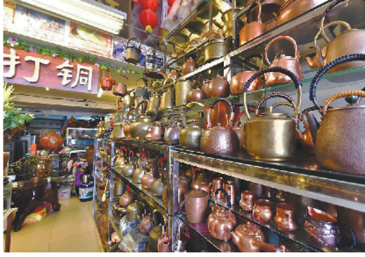
位于恩宁路的铜捞铜煲

不过，记者在走访了多家具有代表性的铜器店发现，这些店铺普遍存在产品同质化严重的现状，相比其它热门商业打卡地，生意相对冷清。看来在人们观念改变、科技不断进步的当下，传统工艺传承者们还要更多地思考，如何将传统文化融入到现代文化和新商业模式当中，以迎合大众的需求与喜好。