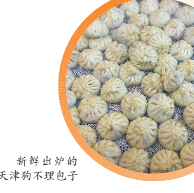
新鲜出炉的天津狗不理包子