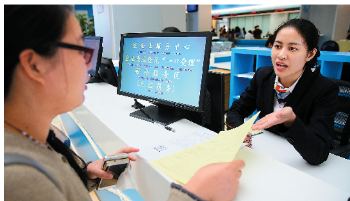
广州营商环境不断优化,大大激发了市场活力

2019年底,中国社科院发布的“由市场主体打分、民营企业说了算”的全国营商环境评价中,广州综合评分为全国第一。