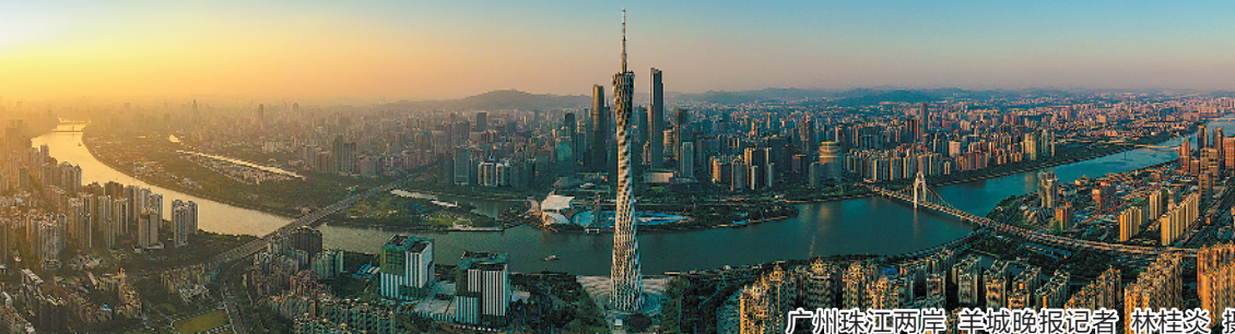
广州珠江两岸

广东省社科院调研组发布的《广州高水平全面建成小康社会调研报告》显示,自2016年以来,广州GDP年均增长6.8%,高于同期全国(6.5%)增速0.3个百分点;2019年,广州GDP总量达2.36万亿元,人均GDP突破15万元,达到高收入地区水平。