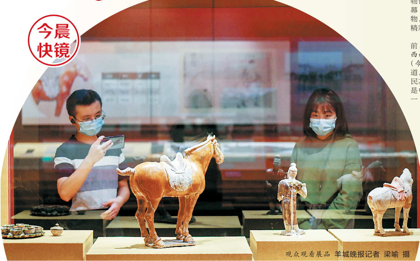
观众观看展品

羊城晚报讯 记者黄宙辉、通讯员黄苏哲报道：“彩绘泥塑打马球俑”再现唐代“打马球”风姿；“慕容威墓志”佐证唐朝与其他部族友好通婚史实；“青釉人首鸟身俑”展示唐代艺术品的超现实主义……今天上午，“唐蕃古道——七省区精品文物联展”在广东省博物馆(以下简称“粤博”)开幕，通过172件/套精品文物，讲述千年前唐蕃古道的精彩故事。