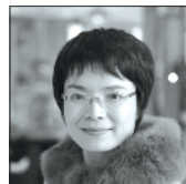
申霞艳 暨南大学中文系教授、广州市文艺评论家协会主席