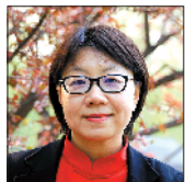
李东华 鲁迅文学院副院长、研究员