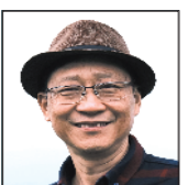
江冰 广东财经大学教授、中国小说学会副秘书长