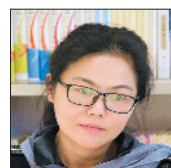
魏微 作家，广东省文学院副院长