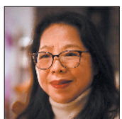
张燕玲 广西文联副主席、《南方文坛》杂志主编