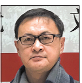
伍立杨 四川省作家协会副主席,文学创作一级