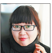
乔叶 河南省作家协会副主席