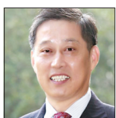
丁晓原 中国报告文学学会副会长、教授,《东吴学术》主编