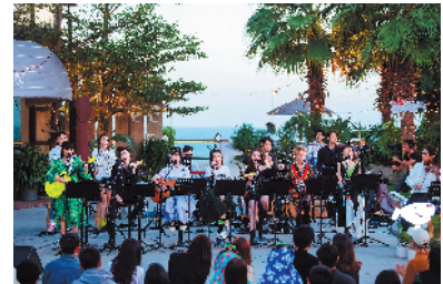
姐姐们在泉州路演

城市要跟这座城市及女性相关的东西互动”,不能只是路演,不然“为什么要浪费在这?时间这么有限,我又那么红!”引得全场大笑。