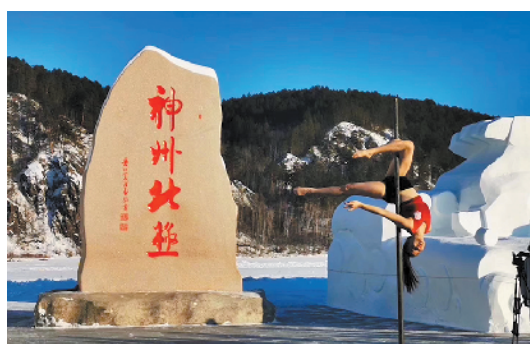
漠河极寒挑战活动

在北极村景区可参观极地体验馆,参加极地自然、极地探索、冰雪乐趣等主题项目探索北极独特风情;在北极圣诞滑雪场可体验到“中国雪期最长的滑雪”。在圣诞村的“中国北极圣诞嘉年华”,会