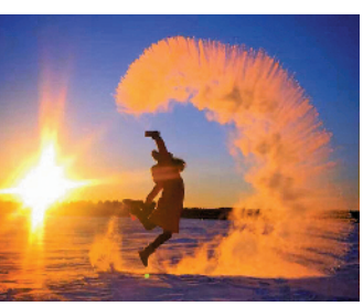
万人泼水成冰表演赛

赛”邀请国家钢管舞队,在冬季极寒之日进行室外钢管舞挑战,打造中国最北的冰雪极限挑战品牌。在冬至期间的“万人泼水成冰表演赛”,游客体验室外泼水成冰。“冰雪汽车越野赛”让广大汽车运动爱好者和海内外游客在冰雪赛道体验刺激。而北极村景区的“体验冰雪温泉三重天”,游客在温泉酒店,冬季室外极冷条件下参加温泉洗浴、雪道滑雪等娱乐项目。