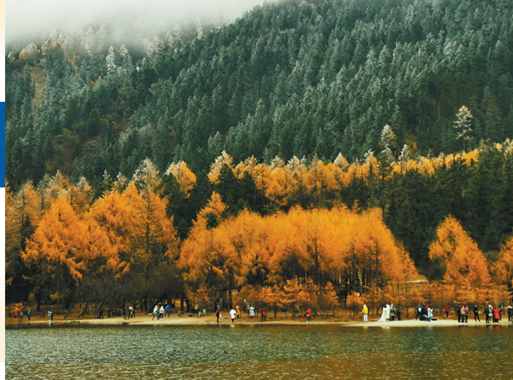
理县毕棚沟