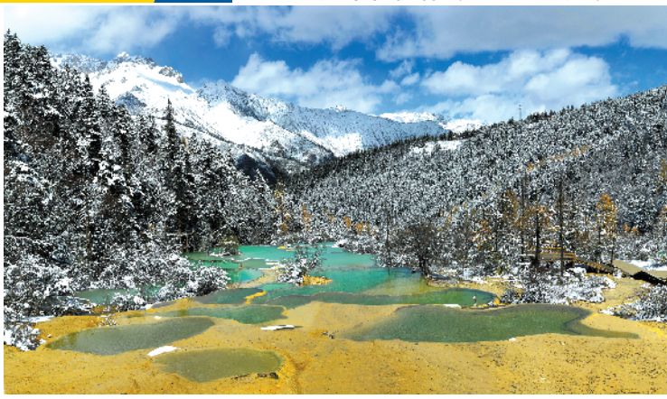
蓝天白云下的黄龙五彩池

羊城晚报:广东游客最感兴趣的四川当地游览内容主要包括哪些?秋冬季的四川有哪些季节性亮点最吸引老广?