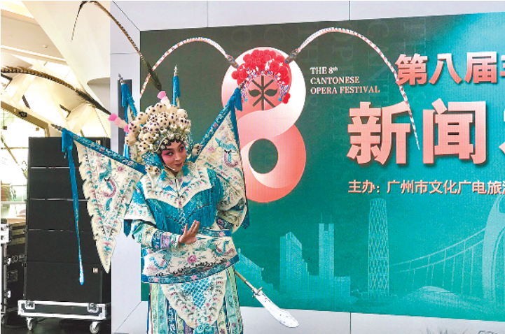
青年演员在发布会现场表演经典剧目《白龙关》

本届粤剧节优秀展演剧目对外公开售票,票价低至30元/张;大联展则免费进场。所有剧目的戏票均在中演票务通上公开发售。