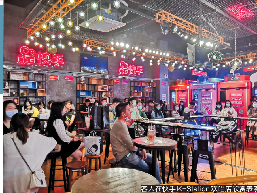
客人在快手K-Station欢唱店欣赏表演

广州天河电脑城推出广州“首店”以来受到了不少游戏爱好者的青睐。据了解，腾讯视频好时光结合了索尼、京东等资源，集游戏、动漫、体育、影视等多元文化娱乐形态于一体，而在广州天河电脑城店还置入了索尼游戏独家线下体验空间Play Station。羊城晚报记者近日走访发现，在广州荔湾悦汇城，腾讯视频好时光在广州的第二家门店已悄然开业，据店员介绍，该店在10月底试营业，11月初正式开业：“未来几年可以在广州看到更多腾讯视频好时光的门店，且都会进驻到商圈里。”