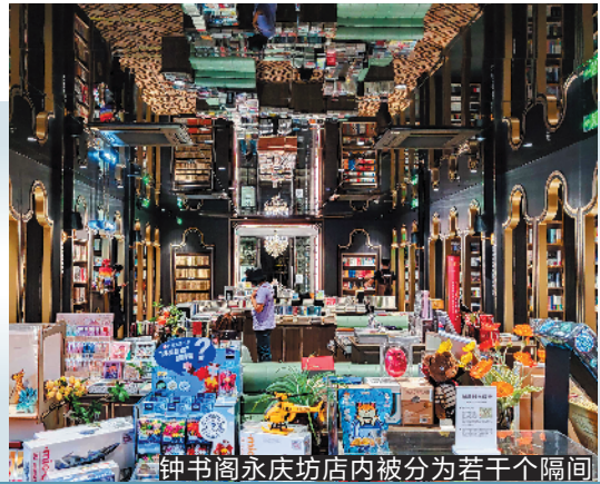
钟书阁永庆坊店内被分为若干个隔间