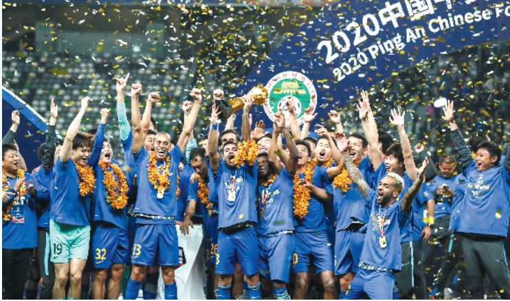
江苏苏宁球员捧起中超冠军奖杯

林:我认为是广州恒大与北京国安的首回合,虽然是0比0,但过程非常精彩,像是两大高手的比划,看似双方毫发无损,其实招招致命,随时都可能进球。裁