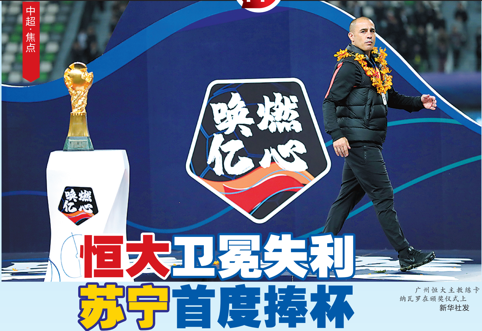
广州恒大主教练卡纳瓦罗在颁奖仪式上