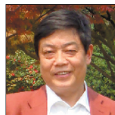
欧阳友权 中南大学文学教授