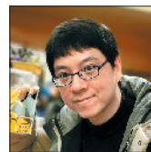
夏烈 杭州师范大学教授、中国作协网络文学研究院副院长