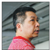
马季 中国作协网络文学研究院研究员、一级作家