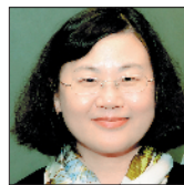
邵燕君 北京大学中文系教授