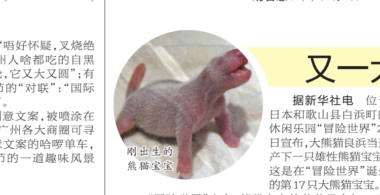
刚出生的熊猫宝宝

近日，碳普惠平台已短信通知200名分别获得200个碳币的市民，并提醒可通过“碳普惠兑换平台”微信小程序兑换礼品。主办方表示，碳币获得者记得于今年12月31日前兑换，逾期将失效。获得独家美食品牌券的市民，更是要记得抓紧时间享用。其中，太平洋咖啡优惠券将于11月24日到期，其他品牌均为11月30日到期。