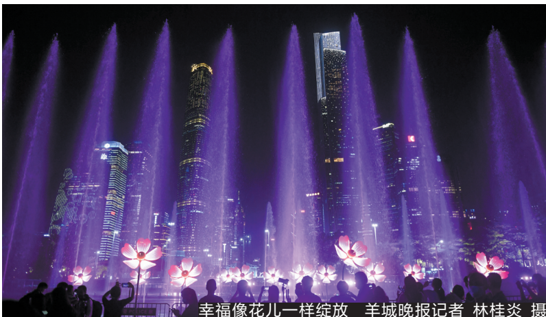
幸福像花儿一样绽放

今年以来,包括法国里昂灯光节、澳大利亚缤纷悉尼灯光音乐节在内的世界重大的城市灯光节活