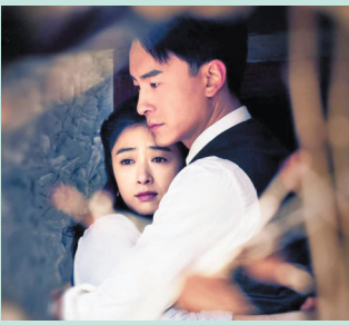
爱情戏有“琼瑶剧”风格

该剧首播后引发观众吐槽，截至12月1日，该剧的豆瓣评分低至3.3分，仅有两千多人评价的数据也证明这部作品在市场上既不“叫好”也不“叫座”。