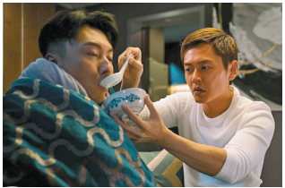
张振朗(右)与王浩信在《盲侠大律师2020》中是好搭档