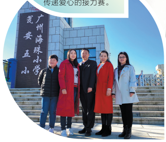
来自广州的五位支教老师

在距广州1000公里外的贵州省黔南布依族苗族自治州瓮安县有一所“海珠小学”,5位来自广州的支教老师今年9月份来到这里后,就架起一座连接着广州和黔南的同心桥,展开了一场播种希望、传递爱心的接力赛。