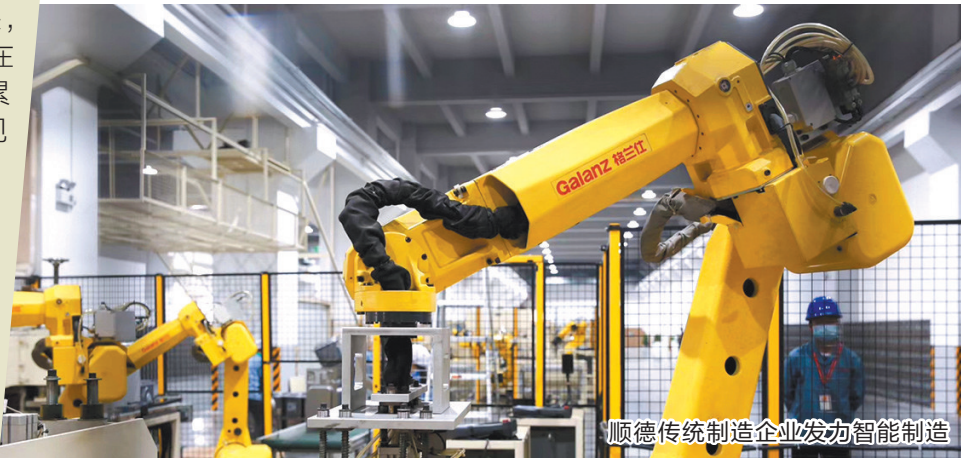
顺德传统制造企业发力智能制造

更为难得的是，2018 年 9 月，顺德又担下建设广东省高质量发展体制机制改革创新实验区的历史重任，为广东全省乃至全国探索更多可复制可推广的改革经验。顺德探索出以村级工业园改造为突破口，撬动高质量发展的独特发展路径。如今，顺德村级工业园改造已累计整理土地 8 万多亩，预计到明年村级工业园将实现应改尽改，彻底退出顺德历史舞台。随着村改持续推进，重塑了顺德产业发展新格局，也让顺德城乡面貌得以涅槃重生。而其腾出的大批高质量发展空间，正吸引着国内各地的优质企业慕名而来，为顺德的未来新发展创造了无限的可能。