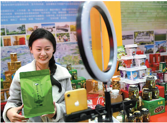
揭阳成立消费扶贫联盟暨扶贫产品展销活动现场，主方向顾客推荐特色农产品

揭阳是广东省农业大市，有炒茶、青梅、竹笋、鲍鱼、菠萝、乌榄等特色农产品。目前，揭阳发挥自身优势，大力发展农业特色产业，加快普宁青梅、惠来南药、揭东竹笋、揭西茶叶 4 个省级现代农业产业园和揭阳市民以“十大现代农业产业园”建设，积极培育农业龙头企业、农民专业合作社、家庭农场等新型农业经营主体，创建普宁市高埔镇、揭东区埔田镇全国农业产业强镇示范镇，已启动“一村一品、一镇一业”建设项目 87 个，2020 年继续新增创建 66 个，打造了水果、蔬菜、茶叶、水产品、花卉、中药材等一批特色农业产业。