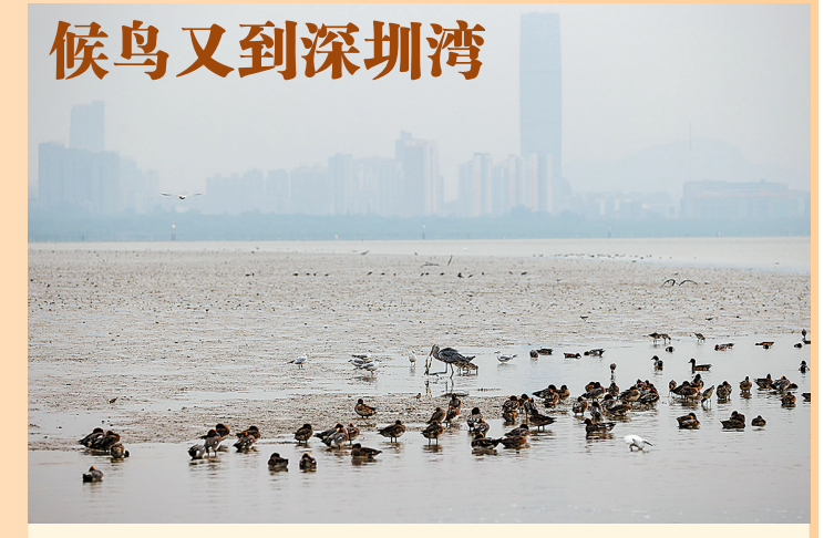
离群鸟,一站就是半小时,可当它突然张开翅膀,伸颈探头时,从不落空,总有大鱼;远处,一只黑脸琵鹭缓缓降落,马上把扁嘴插进泥地,摇头晃脑起来,“琵鹭来了!”相机高速连拍的快门声同时响起,这是对濒危物种的礼遇。

每年的12月到来年的1月,是迁徙的候鸟会聚深圳湾的季节。 12月7日,在深圳湾的滩涂上,一片密密麻麻的黑点,那些都是候鸟。琵嘴鸭成群结队,浮在水面上,用形似琵琶的扁嘴觅食滩涂里的鱼虾;苍鹭总是单独站立,远