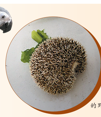
市民发现的野生刺猬