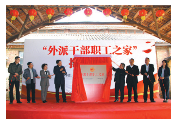
清远有了“外派干部职工之家”

末运行图,在维持实行赤湾-盐田路区间高峰行车间隔4分钟的基础上,还延长了福田站、深外高中-莲塘口岸区间各站点的停留时间5-10秒不等,使之更加适合周末客流上下车的需要。 深圳地铁介绍,作为2020年新线开通后的首次“增能增力”,本次行车间隔调整通过前期广泛收集市民的意见和建议,对市民的重点关注项和实际乘车需求进行了逐步优化改进。