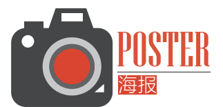
鉴定对象：《独行月球》