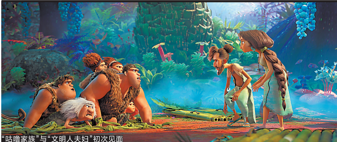
“咕鲁家族”与“文明人夫妇”初次见面

10日，组委会还组织全体参与广马工作的人员，包括裁判、志愿者、组委会工作人员、赞助商、供应商等进行核酸检测，上述人员于11月30日起至12月13日，必须通过粤康码防疫平台进行每日健康申报。 赛前，针对各类人员，组委会开展了疫情防控应急培训和应急演练。赛事活动过程中，工作人员必须按防控要求操作，必须全程佩戴口罩，工作时保持适当间隔。