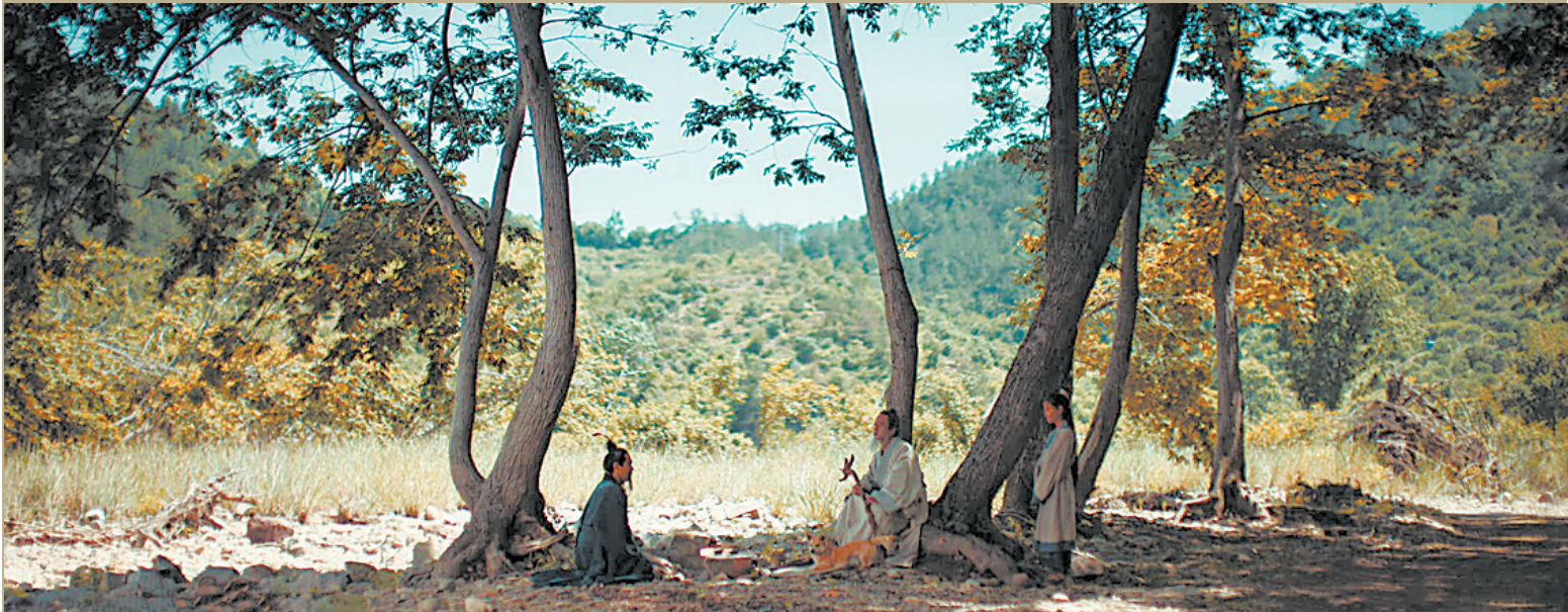
第一集“春秋”讲述了孔子与老子的会面