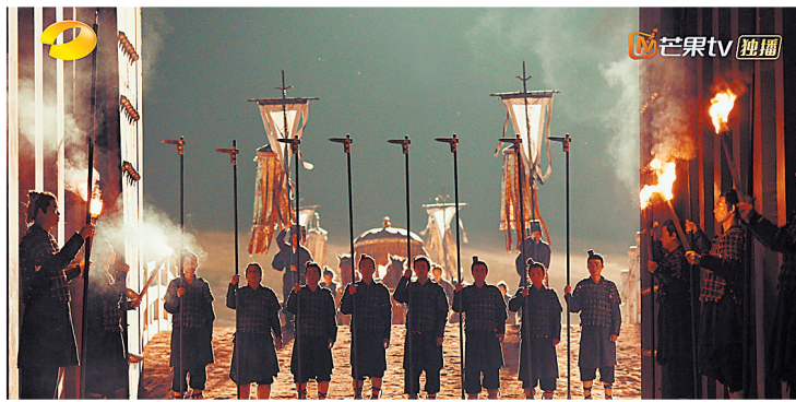
画面体现出对称美

除了《醉后赢家》,开心麻花在12月还安排了《瞎画艺术家》《乌龙山伯爵》等剧回归。