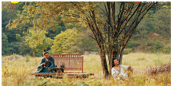
开阔明亮的外景体现庄子的洒脱超然