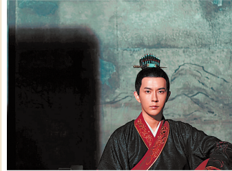
于朦胧饰演汉汉武帝