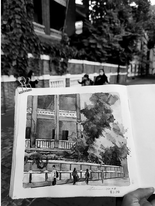
“速写广州”成员作品