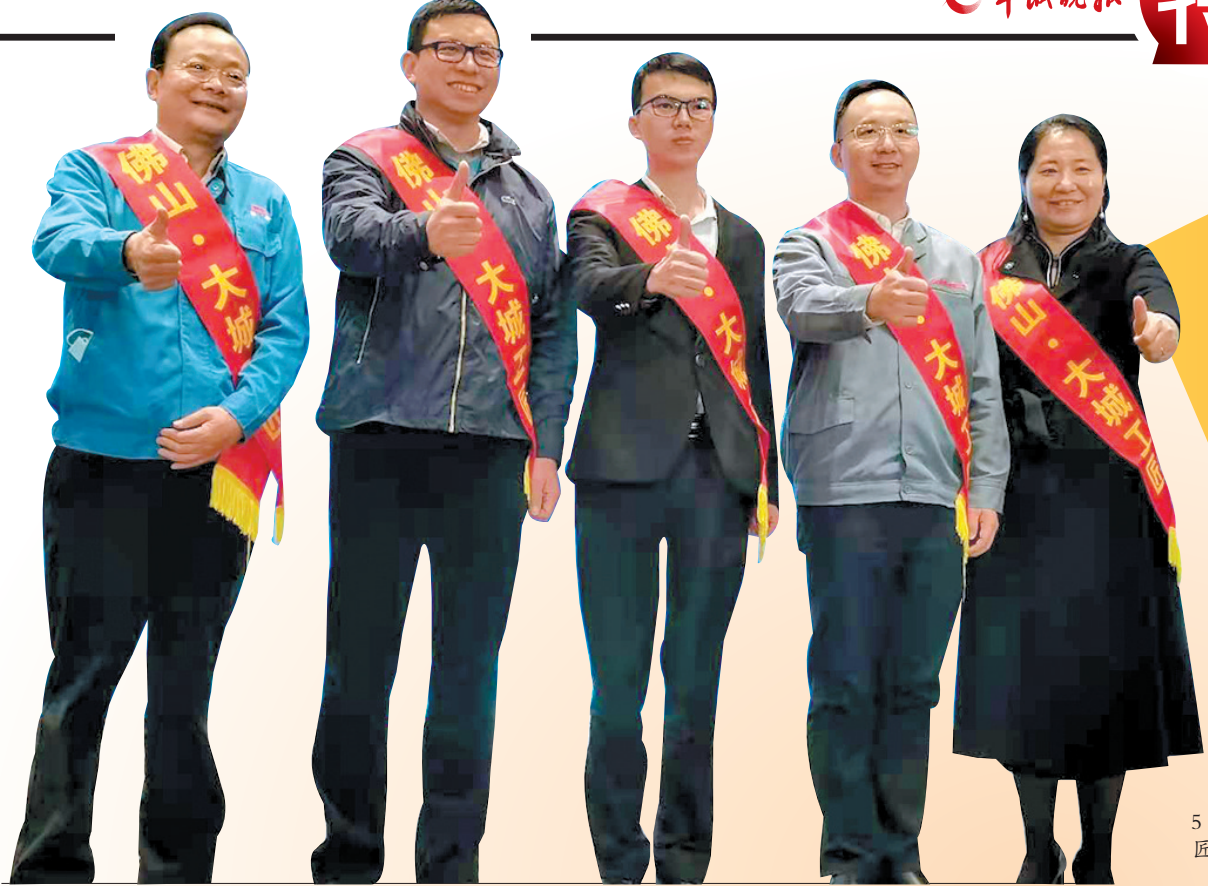
参与交流的 5位佛山大城工 匠合影留念

佛山启动“佛山·大城工匠锻造工程”系列活动,再次向全世界展示佛山制造高质量发展成果