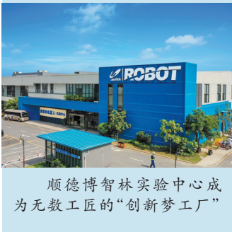
顺德博智林实验中心成为无数工匠的“创新梦工厂”