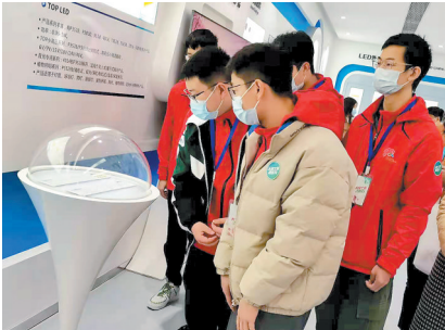
▲全国技能大赛优秀选手代表参观佛山企业