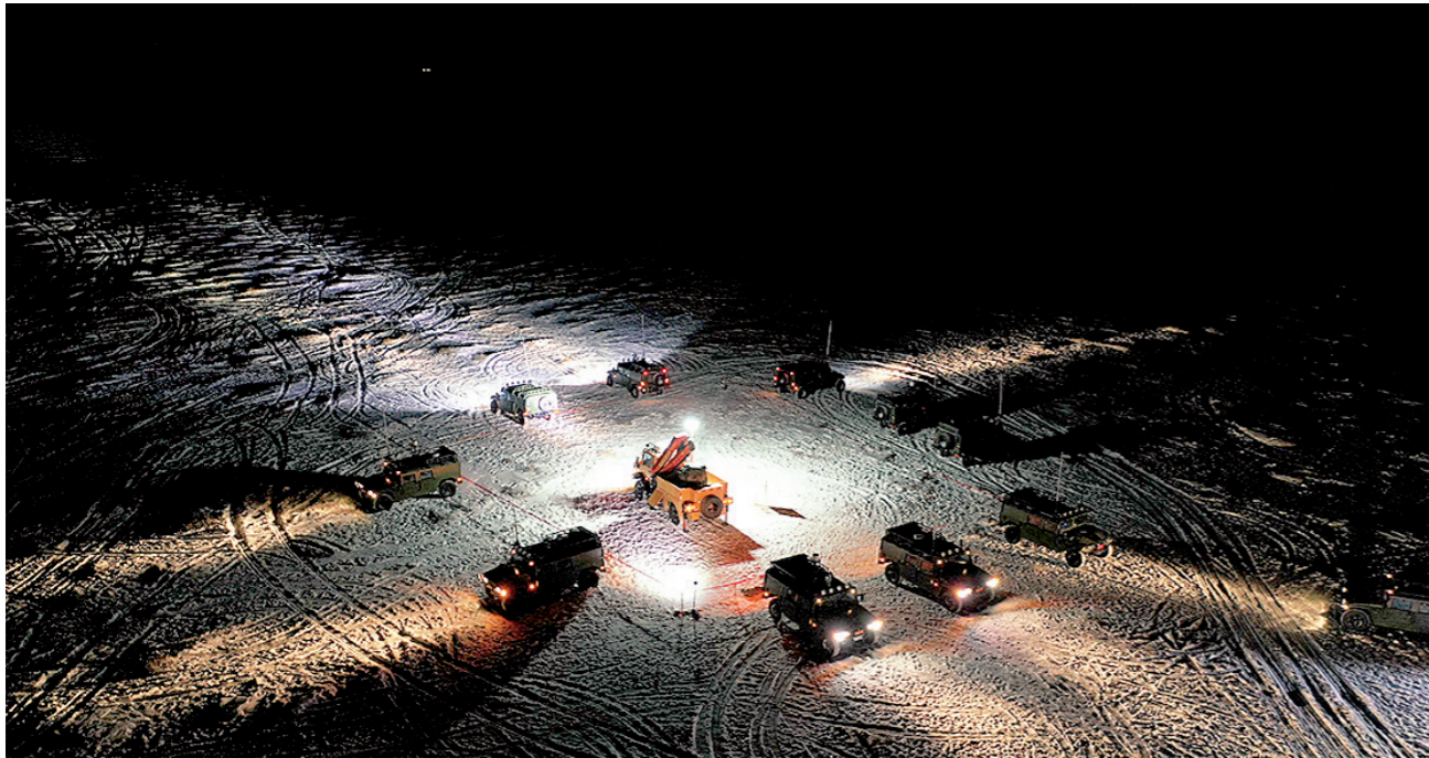
嫦娥五号返回器回收现场（无人机照片）