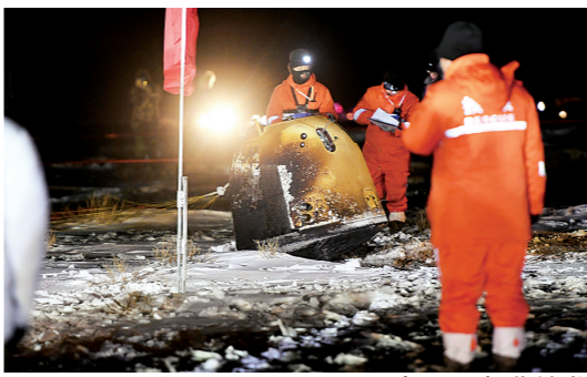
嫦娥五号返回器安全着陆