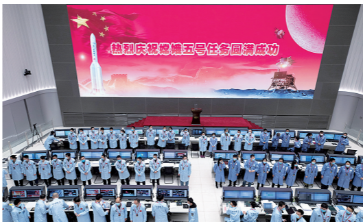
北京航天飞行控制中心嫦娥五号任务飞控现场