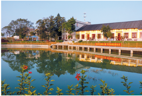
改造后的革命老区小洞村焕然一新

杜婉玲表示,每一项政府年度民生实事项目,建设落实情况关乎群众利益,督查室邀请人大、政协、媒体等各方代表走访已经形成了一种常态化的动作,实现了多方参与、共同监督机制。此外,民生实事项目就算今年完成了,他们后续还要做大量的巩固以及延伸工作,譬如他们正在谋划革命老区高质量发展示范区建设工作。