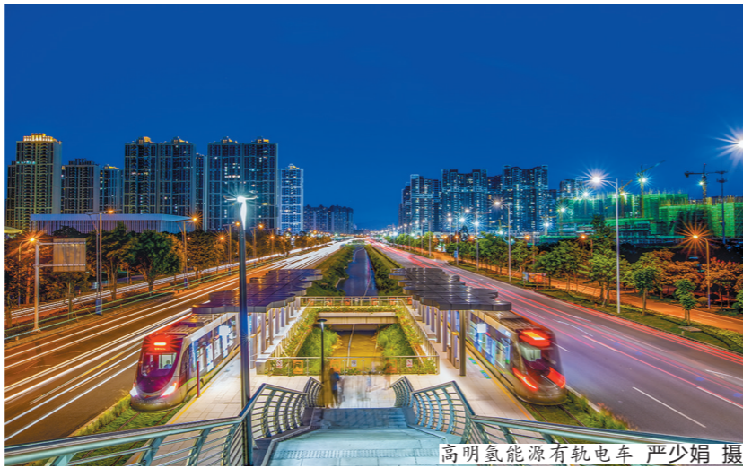
高明氢能有轨电车