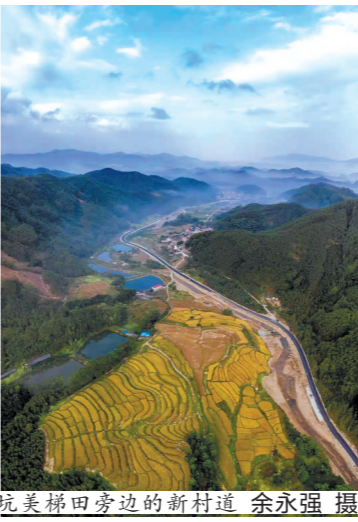
坑美梯田旁边的新村道

“在高明生活,幸福指数很高。”佛山市高明区土生土长的谢先生告诉记者,这些年来,高明一年一个变化,医疗、教育、环境等方面都有质的飞跃。