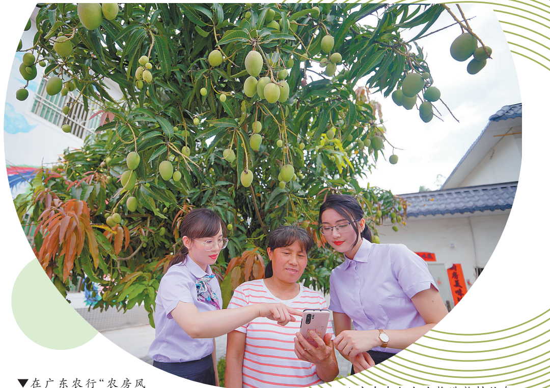
▼在广东农行“农房风貌贷”助力下,韶关翁源县江尾镇金星村农房换新颜

在“户贷社管合营发展”模式下,贫困户可以将土地租给合作社收取租金,并在合作社劳动