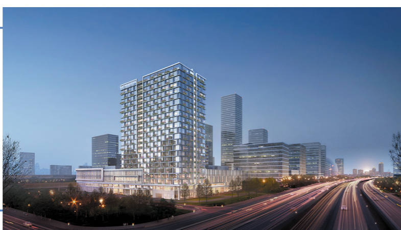
深圳前海泰康国际医院(筹)效果图

12月19日上午，深圳前海泰康国际医院(筹)奠基暨与西达赛奈国际合作签约仪式在前湾医院项目现场举行。这是泰康保险集团在粤港澳大湾区高品质医养布局的旗舰项目，它的动工和国际合作正式达成，对泰康大健康生态体系、泰康医疗服务体系的深度建设具有里程碑意义。