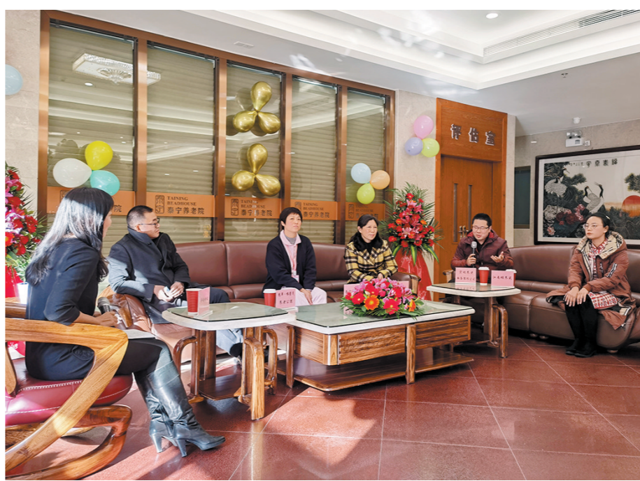
文/羊城晚报记者 林清涛 实习生 杨楚楚 图/许俊杰

如何“老有所养”，这既是关系到每个家庭的“身边事”，也是进入老龄化社会需要探索的社会热点问题。目前，广州市正有序推进综合养老服务中心(颐康中心)建设，这将对行业带来怎样的发展契机?疫情防控常态化下，许多人理想中的“旅居康养”模式，有何变化?更为精细化、个性化的养老服务，能否助力养老产业升级?