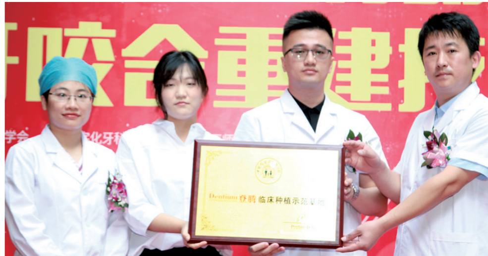
广东省全民爱牙行动活动现场

为贯彻落实《“健康中国2030”规划纲要》，进一步加强健康口腔工作，提升群众口腔健康意识和行为能力，助力实现65-74岁老年人平均留存牙数较十年前增加1.5颗的目标。即日起，中家医为启动广东省全民爱牙行动，正式向广东省内群众开放免费种牙，只要符合申领条件的省内缺牙长者都可以致电报名免费参加，并享受免费口腔检查、硕博专家亲诊等种牙专项援助诊疗服务。