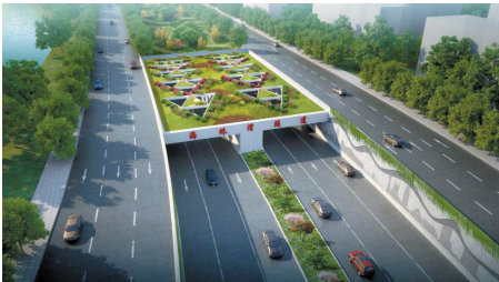
海珠湾隧道南洲入口效果图

本次开工的海珠湾隧道工程即广州南站快速通道北段工程,路线全长约4.35公里,北接东晓南高架,向南以双管单层盾构隧道形式下穿珠江沥涌水道、洛溪岛和三枝香水道,继续以暗埋隧道形式穿过南浦大道后接出地面,接入南段工程。主线采用设计速度60公里/小时、双向6车道的城市主干道建设标准。建设内容包括过江隧道1座、互通立交3处,从北至南依次为南洲路立交、环城高速立交和南浦岛立交,分别与南洲路、环城高速和南浦岛实现交通转换。